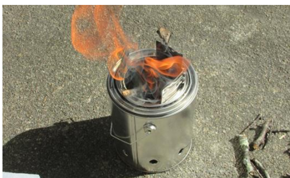
二次燃焼型携帯缶ストーブ製作